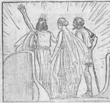
"Los dioses os han enviado desde el Mundo de la Oscuridad, hasta nuestra tierra, en donde has sido elegida como la más bella y escogida virgen de nuestros dominios. Ha llegado la hora de que os vayáis!

Pero partiréis de este altar, donde cada año, a esta misma hora, se sacrifica a nuestra más bella doncella en homenaje al Sol, a la Luna y al Rey del Universo. Cuando os halléis en presencia de ese gran Dios, cumpliendo la visión que os ha sido dada, pedidle que permanezca siempre con nosotros! Y con gran sorpresa, Prudencia vió cómo el Rey Markeedon