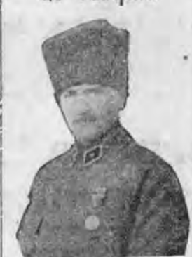
MUSTAFA KEMAL PASHA